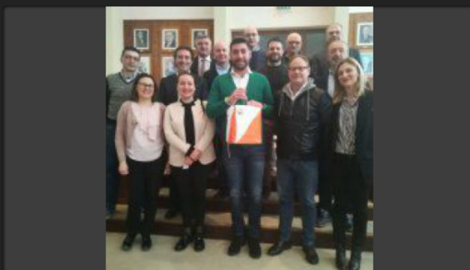
L'incontro in Comune